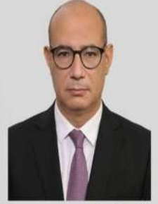
أ.د فايز محمد حسين وكيل كلية الحقوق لشئون التعليم والطلاب