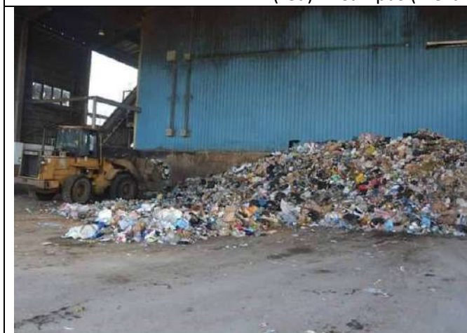
Waste reception hall in Nahdet Misr company for waste collection in Alexandria