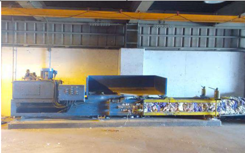
Paper and carton baler in Nahdet Misr company for wastes collection in Alexandria