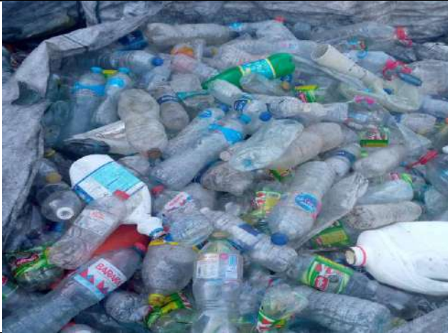
Mixed plastic collected by Nahdet Misr company for wastes collection in Alexandria