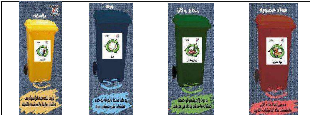
Program for separation of Paper (blue), Plastic (yellow), aluminum cans and glass (green) and organic waste (red) in Campus (Alexandria University, Egypt)