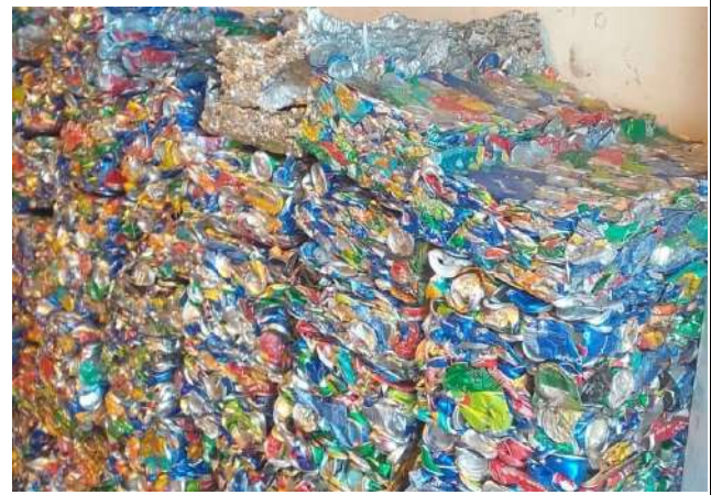
Cans waste collected by Nahdet Misr company for wastes collection in Alexandria