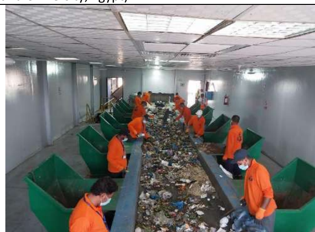
Manual sorting hall in Nahdet Misr company for waste collection in Alexandria