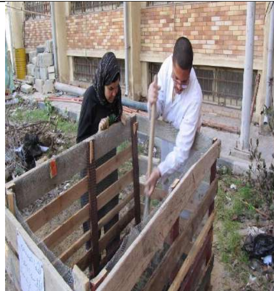
Leaves and organic waste were treated for the vermi-compost to produce organic fertilizers to use in the Campus gardens (Alexandria University).