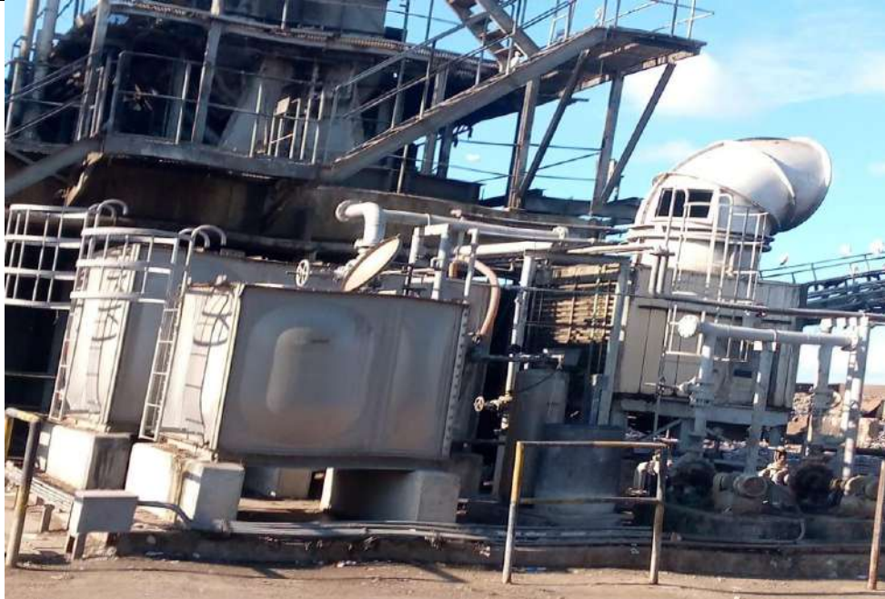
Organic matter separation unit in Nahdet Misr company for wastes collection in Alexandria