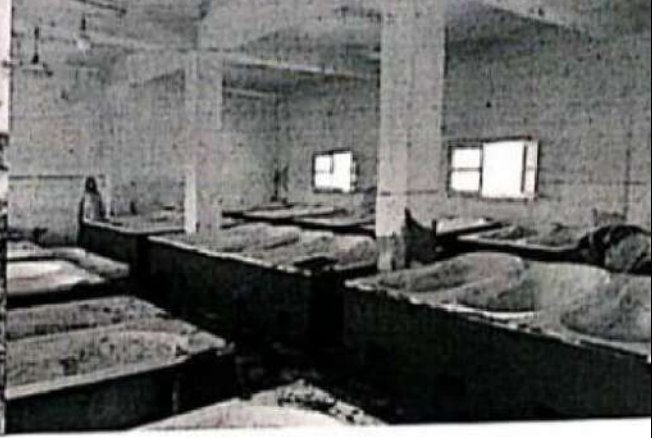
The Faculty of Agriculture recycles 100% of its organic waste (Alexandria University).