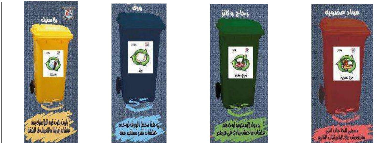
Program for separation of Paper (blue), Plastic (yellow), aluminum cans and glass (green) and organic waste (red) in Campus (Alexandria University, Egypt)