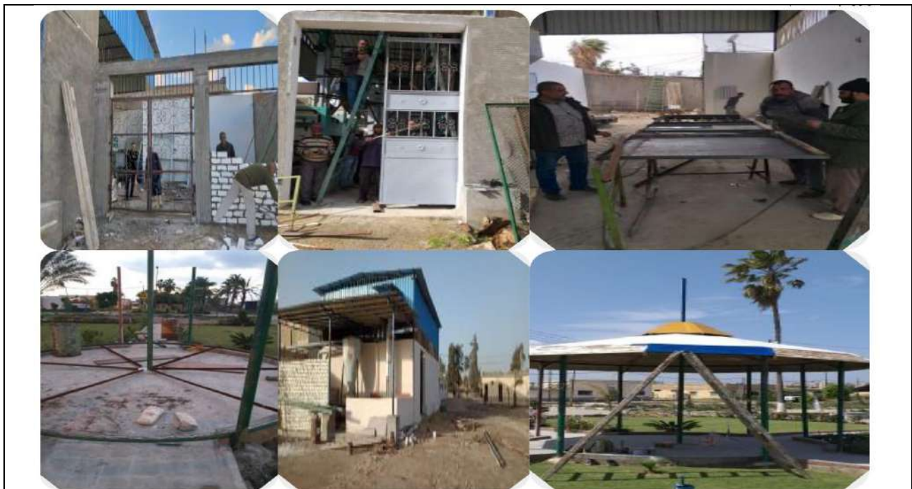
Recycling Program for both materials and equipment with metals and derivatives (Alexandria University, Egypt)